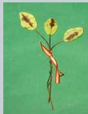
4. maj nål fra 1945 som blev båret af det danske folk ved tyskernes overgivelse efter anden verdenskrig.